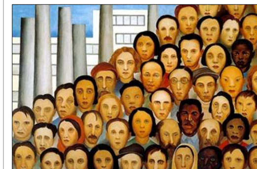
Os Operários, 1933, Tarsila do Amaral.