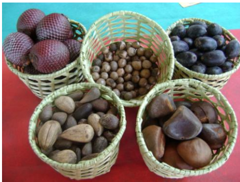
Foto 19 – Sementes de Oleaginosas (buriti, murumuru, patuá, pracaxi e andiroba)

Há ainda na ASMIM outro segmento que trabalha com a comercialização de oleaginosas, com destaque para o pracaxi, patuá, murumuru ( Astrocaryum murumuru ), miriti, andiroba ( Carapa guianensis ) para venda in natura (foto 17).