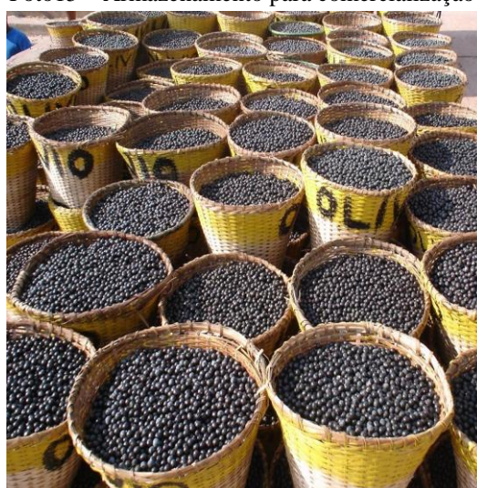
Foto 15 – Armazenamento para comercialização