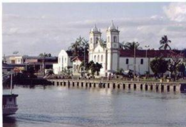
Imagem II – Frente da cidade de Igarapé-Miri

A mesma autora refere-se ao nome do município como sendo formado por vocábulos usados na linguagem de povos tupi, chamados de povos da água. Igarapé é composto por “yg” (rio ou caudal d’água), “iara” (senhora) e “pé” (caminho) e significa “caminho da senhora das águas”. Já a palavra Miri (ou mirim) significa pequeno, assim a tradução seria “pequeno caminho da senhora das águas” retratando bem a paisagem central da sede do município às margens do rio (imagem I).