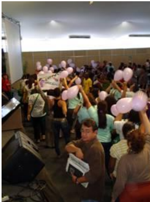
Foto 1- Manifestação das mulheres durante a realização da II CONAES.

balões lilases, em coro, com palavras que ressaltavam a forte presença da mulher na ES (62% das pessoas envolvidas no encontro eram mulheres).