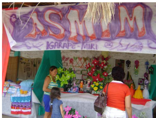
Foto 18 – Comercialização na I feira de empreendimentos solidários de Igarapé-Miri 2010.